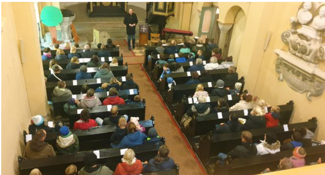
Martinsfest in Rathmannsdorf - gemeinsam mit der Evangelischen Grundschule (oben).