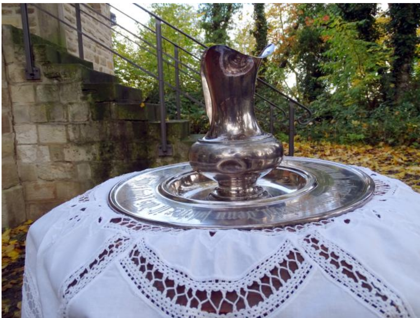
Der Reformationstag in Warmsdorf stand dieses Jahr ganz im Zeichen einer Taufe (unten).